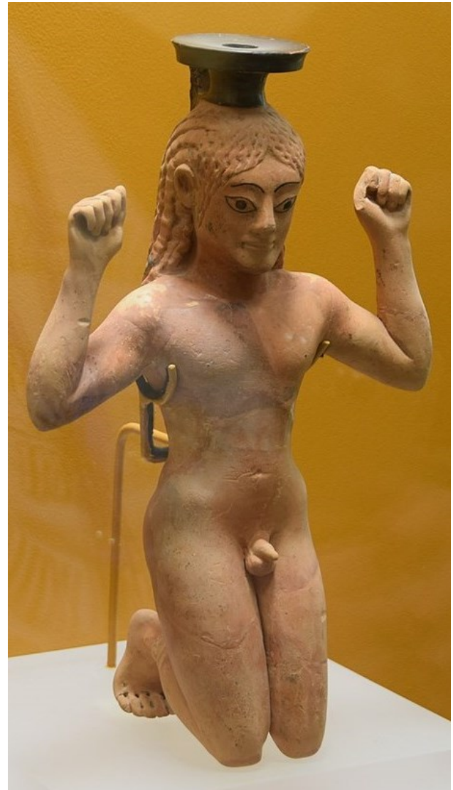
Vase à parfum en forme d'athlète agenouillé, vers 540 avant J.-C., stoa d'Attale, Musée archéologique national d'Athènes.

Parmi les parfums les plus connus de l'Antiquité, les Grecs admirent le kyphi , un mélange utilisé en Égypte et réservé aux offrandes aux divinités. La liste exacte de ses 16 ingrédients est inconnue, mais on sait qu'il contenait notamment du vin vieux, du miel, des raisins secs épépinés, de la résine de térébinthe, de l'asphalte, de la myrrhe, du lentisque, du genièvre de deux espèces et de la cardamome 4 . Dans le chapitre « Amorces de scénarios », l'amorce « Divines fragrances » évoque le kyphi .