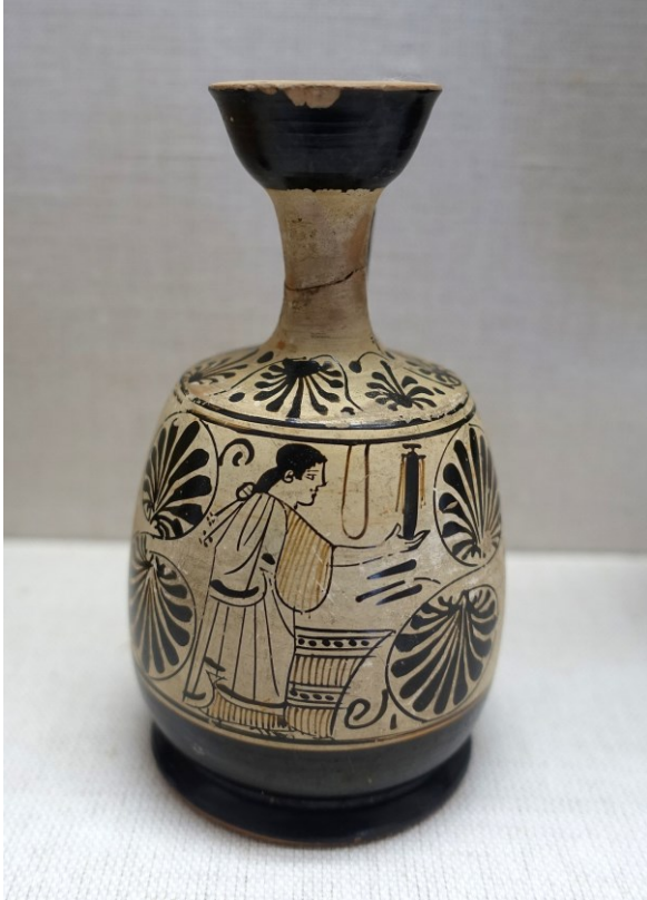
Lécythe montrant une femme tenant un lécythe. Athènes, 470-460 av. J.-C. Würzburg, musée Martin von Wagner.

Parmi les trésors que peut rêver de posséder un héros ou une héroïne, il n'y a pas que l'or et les bijoux, les bêtes ou les terres : il y a les parfums 1 . Il existe des parfums pour toutes les bourses et même les gens les plus humbles savent se préparer des huiles essentielles exhalant une aura suave à l'aide d'ingrédients tout à fait communs. Mais d'autres parfums sont des produits de luxe. Ils existent de longue date dans tout le cosmos, où ils ont été inventés, bien avant les Grecs, par les habitants de l'Asie, en Mésopotamie, en Égypte et en Arabie heureuse, le pays des Érembes. Non contents d'importer ces merveilles, les Grecs et les Grecques ont appris